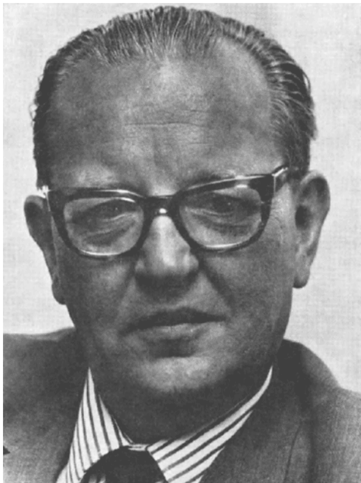
dr. j.a.h.j.s. bruins slot

Randwijk kon opschieten. Tussen ons was achting, waardering, echte vriendschap, ook al zagen we elkaar de laatste jaren minder. [p. 98]